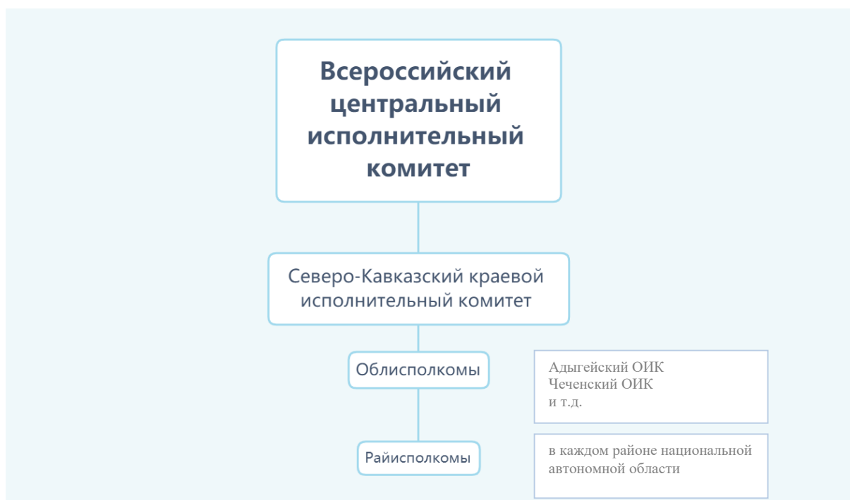
Рис. 1. Схема подчиненности женотделов при органах власти СССР

Основной целью женотделов было воспитание женщин в духе социализма. Для того, чтобы вовлечь женщин в общественную и политическую жизнь, в частности, организовывались собрания, на которых выбирались представительницы отдела – делегатки. Делегатки занимались помощью больным и раненым солдатам Красной армии, агитацией и пропагандой во время Гражданской войны и после, участвовали в борьбе с голодом и разрухой, организовывали субботники, открывали эвакуационные пункты, общественные столовые, создавали партийные школы в целях ликвидации неграмотности.